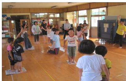
6/2宮大生とあそぼう