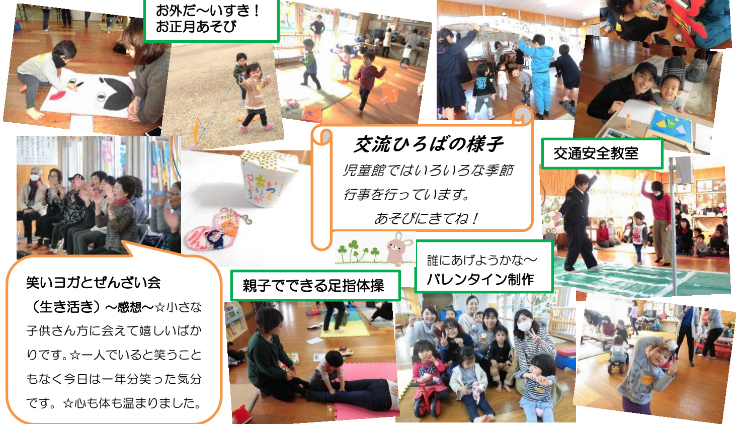
お外だ~いすき! お正月あそび