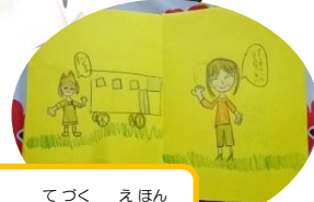
12/17 てつく えほん 手作り絵本