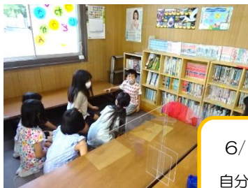
6/16、11/2 アサーション 自分の気持ちを伝えるトレーニング