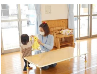
絵本の読み聞かせ