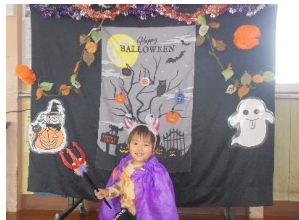
ハロウィンを楽しもう