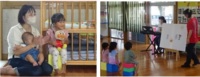
大人気の夢っこシアターが恒久児童館にきました！！ 手あそびやパネルシアターなど子どもたちが夢中になって見て、聞いて、楽しんでいました！！