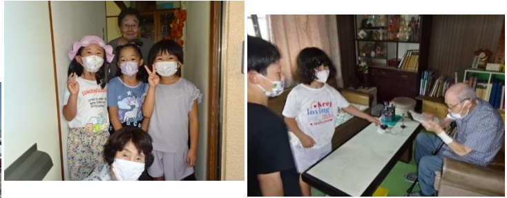
地域の高齢者のおじいちゃん、おばあちゃんのお家を訪ねて、お手紙とアイロンビーズのプレゼントを届けました！