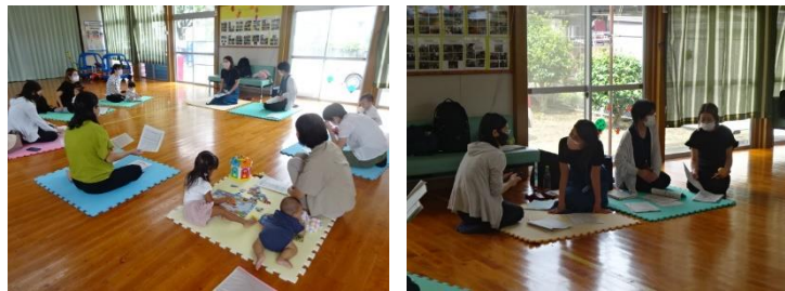
宮崎市保育幼稚園課の方に来館いただき、こども園や幼稚園などの手続き等の説明、また入園を考えておられる子育て親子の質問や相談を受けました！