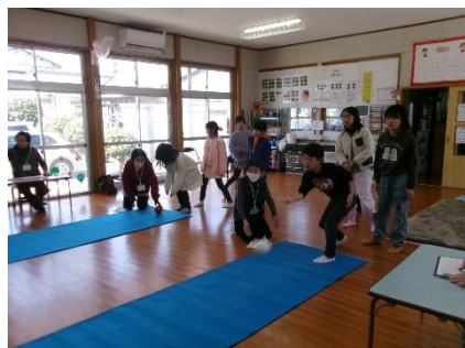
3/2(土) ふれあいボウリング大会

今年度2回目のボウリング大会を実施しました！木曜会の皆様にボランティアで来ていただき、アドバイスやサポートをして頂きました。子どもたちは、ストライクやスパアが出るとみんなで大盛り上がり！木曜会の皆様ありがとうございました！