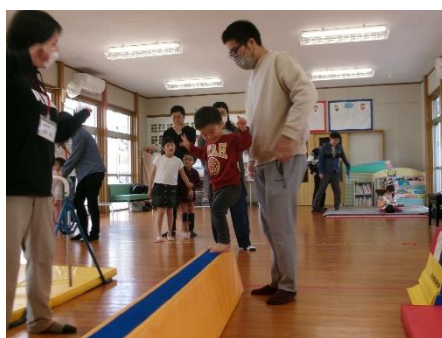
2/18(日) パパとあそぼう(かみむらスポーツ)

大好きなパパとふれあい遊びや、跳び箱・平均台・鉄棒などで身体を動かして楽しく過ごしました。お父様方、お疲れ様でした！