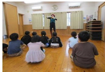
パントマイムショー