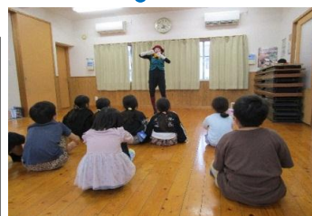
パントマイムショー