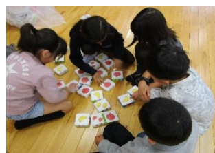
キャップでオセロ (SDGs)