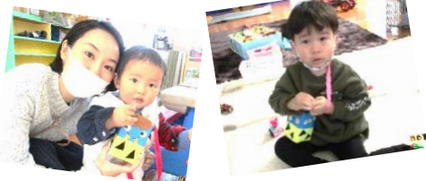
豆入れ制作 コロナに負けないぞ！